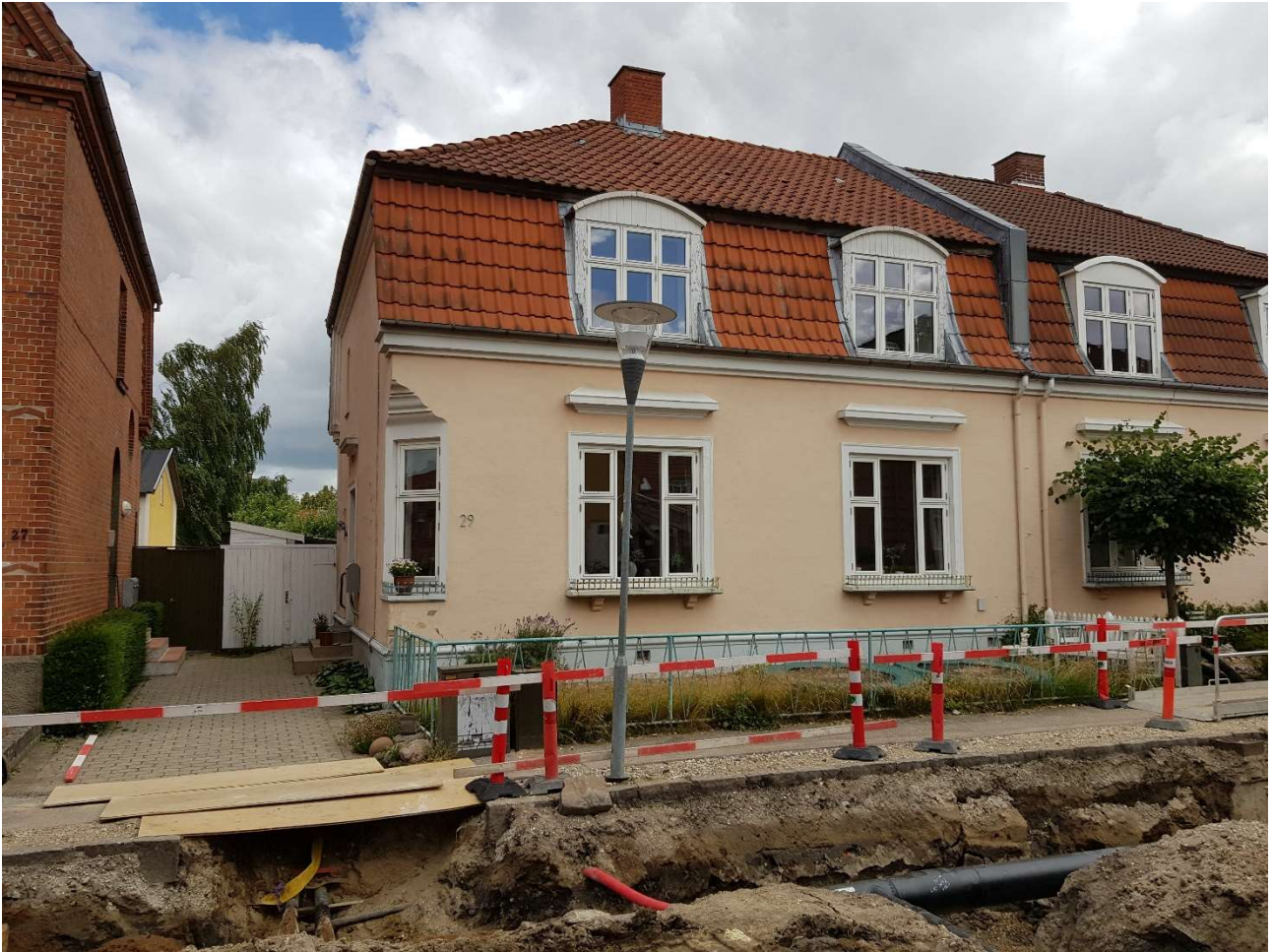
Pileborggade 29. Her blev jeg født på 1. sal.