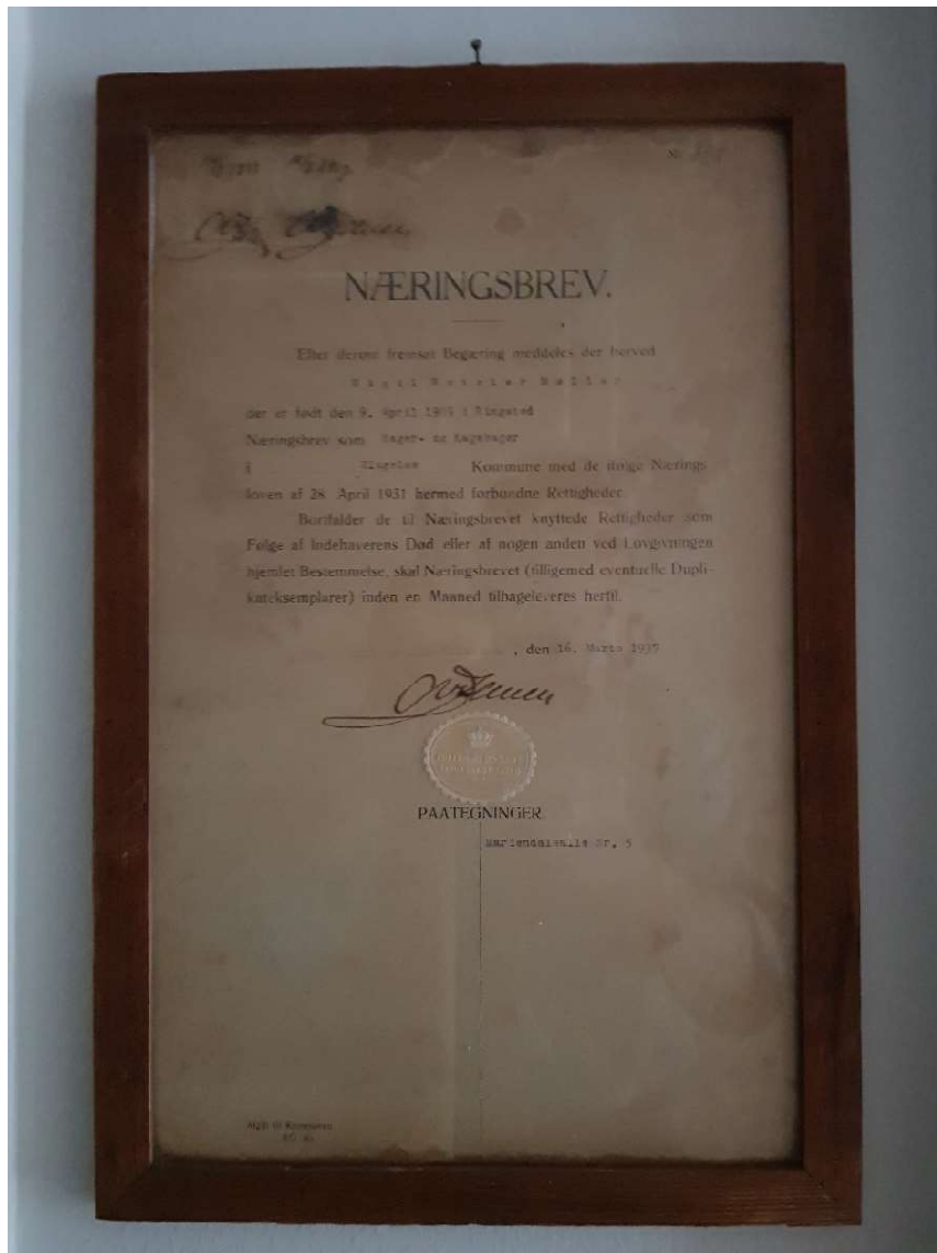
Fars næringsbrev af. 16. marts 1937 Som "Bager- og Kagebager"