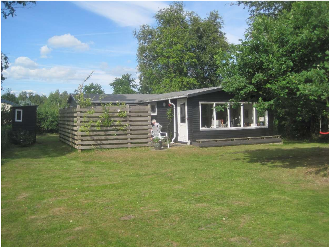
Åvej 5, Ornum strand v. Gørlev Sj.