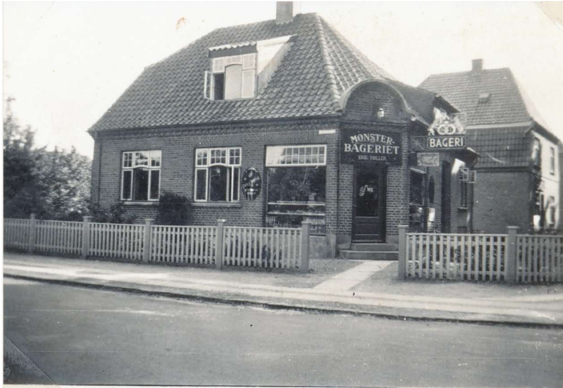
Mønsterbageriet, Mariendals allé 5, Slagelse. Billedet er taget fra Sct. Jørgensgade. Min bopæl frem til august 1956

Fars fritidsinteresser var haven og skak. Det oprindelige haveanlæg var med mange bede kantet med lave buksbomhække, og så var der en mindre græsplæne. Der var også tre æbletræer og op ad husets sydmur var der to pæretræer. Haven var temmelig besværlig at vedligeholde. Derfor omlagde far haven, så den blev opdelt i tre niveauer med en højdeforskel på ca. 30 cm mellem hver. Træerne blev bibeholdt. Men bagerst i haven blev der indrettet et langt staudebed. Resten blev udlagt som græsplæne. Det blev et haveanlæg, som mange af kvarterets husejere roste far for.