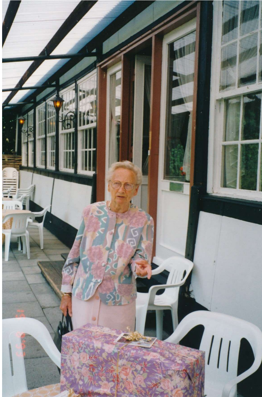
Mor ved sin 80-års fødselsdagsfest på Arnehavehus, Slagelse, august 1993

Mor døde den 26. januar 1994. Nogle måneder forinden havde Mor den 15. august 1993 rundet de 80 år med en familiefest på Arnehavehus i Slagelse lystskov. Det var en fin sammenkomst, hvor hele familien deltog i det allerbedste augustvejr. Den sidste sommer havde Mor også mod på at