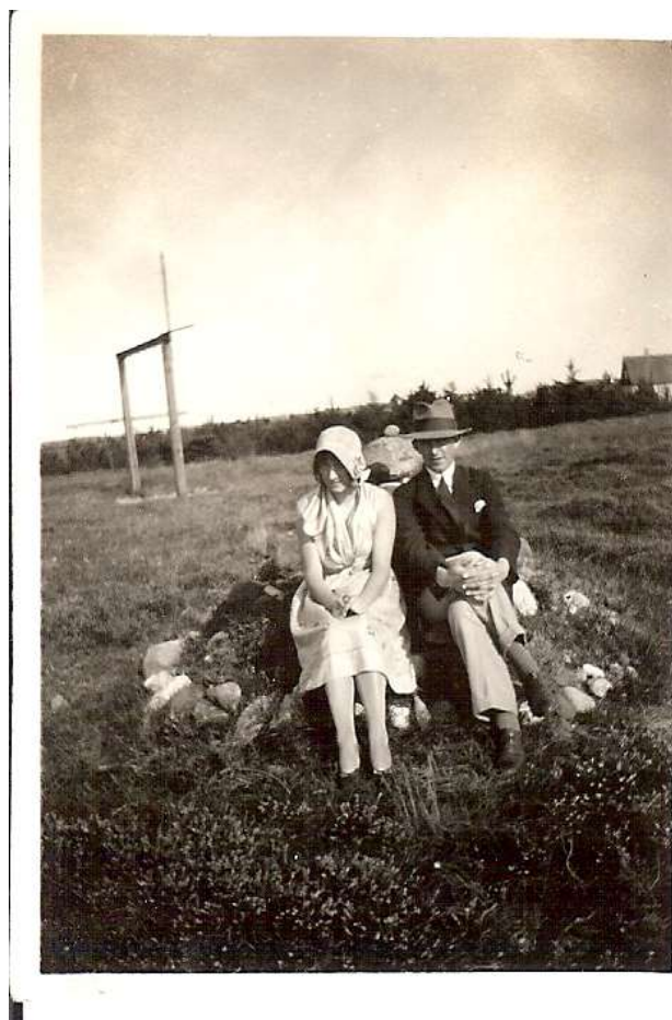
Min mor og far på deres nok første fælles besøg i Sommerhuset "Maagen", Jyderup Lyng, ca. 1930 de var da hhv. 17 og 21 år.