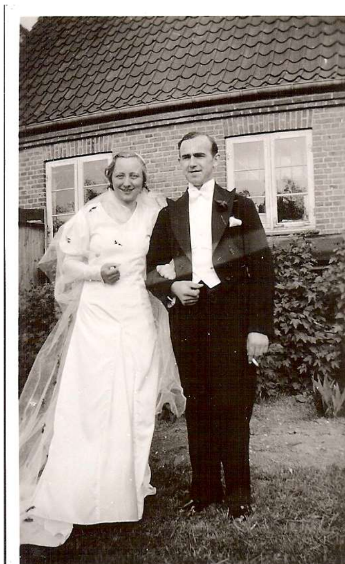
Bryllupsbillede af mor og far den 13. maj 1934