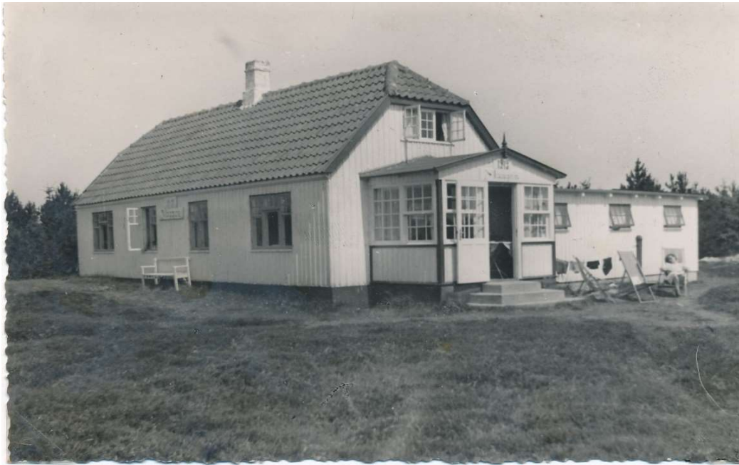
Maagen af 1919, Jyderup Lyng i Sejerø bugten, mellem vej 10 og 11 Grunden var ca. 2,5 tønde land. I dag er grunden udstykket og der kommet yderligere 3 huse på grunden

Det var en smuk lyngbeklædt grund. Selvom min far kun var tre - fire år, da grunden blev anskaffet, huskede han tydeligt sit første besøg. Der var ingen beplantning og ingen huse, så det var én stor legeplads. Sådant var det de første år. De solgte grunde skulle først og fremmest beplantes for at afmærke de enkelte grunde og for at give læ så hurtigt som muligt. Der var temmelig langt ned til vandet, og for at få noget læ, plantede min Farfar et par række fyrretræer langt nede på grunden og i nogen afstand fra strandkanten. Det tog udsigten, men den savnede de ikke, for de kunne jo bare gå derned. Der blev også boret en brønd, så der kunne pumpes vand op, og et midlertidigt toiletskur blev også bygget.