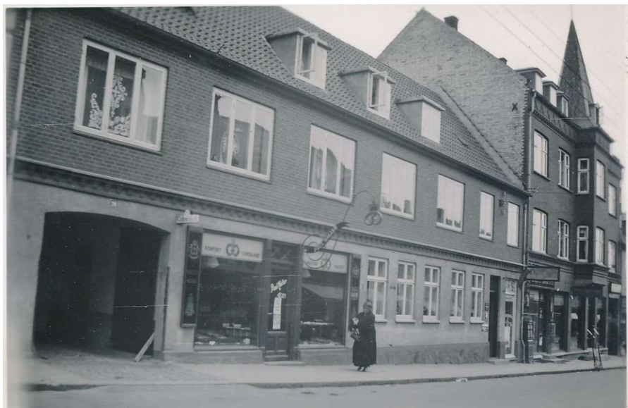
Sct. Hansgade 24, Ringsted Nu nedlagt som bageri og forretning

Både far og mor opfattede sig som stammende fra Ringstedfamilier, om end mors barndom var noget omflakkende. Jeg kender ikke præcist de huse, hvor mor har boet, men kun adresserne og dermed husene set fra vejen. Men fars familie havde i et par generationer haft deres bopæl i Sct. Hansgade 24, hvor der både var lejligheder, et stort bageri med tilhørende forretning.